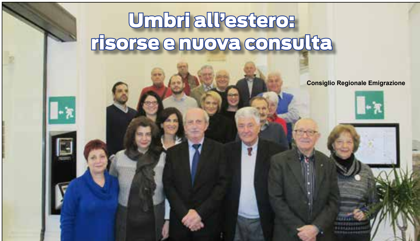
Consiglio Regionale Emigrazione

Mantenere e sviluppare i legami culturali, sociali ed economici con gli umbri residenti all'estero, con le loro famiglie ed associazioni promuovendone la partecipazione alla vita della comunità regionale, si agevola inoltre l'eventuale rientro e reinserimento dei corregionali in Umbria. Questo l'obiettivo del disegno di legge proposto dalla Giunta della Regione Umbria sugli "Interventi a favore degli umbri all'estero e delle loro famiglie" approvato dall'Assemblea legislativa della regione con 9 voti a favore (Pd, SeR e Misto-Mdp) e 2 astenuti (M5S). Il nuovo testo sostituisce la vecchia legge regionale in materia, che risaliva al 1997. Nel disegno di legge, sottolinea il Consiglio regionale, particolare attenzione è dedicata a combattere la "fuga dei cervelli umbri" con il fine di far rientrare le eccellenze nella regione. Lo stanziamento attuale è di 175mila euro, a cui si sommano 100mila euro di fondi europei.