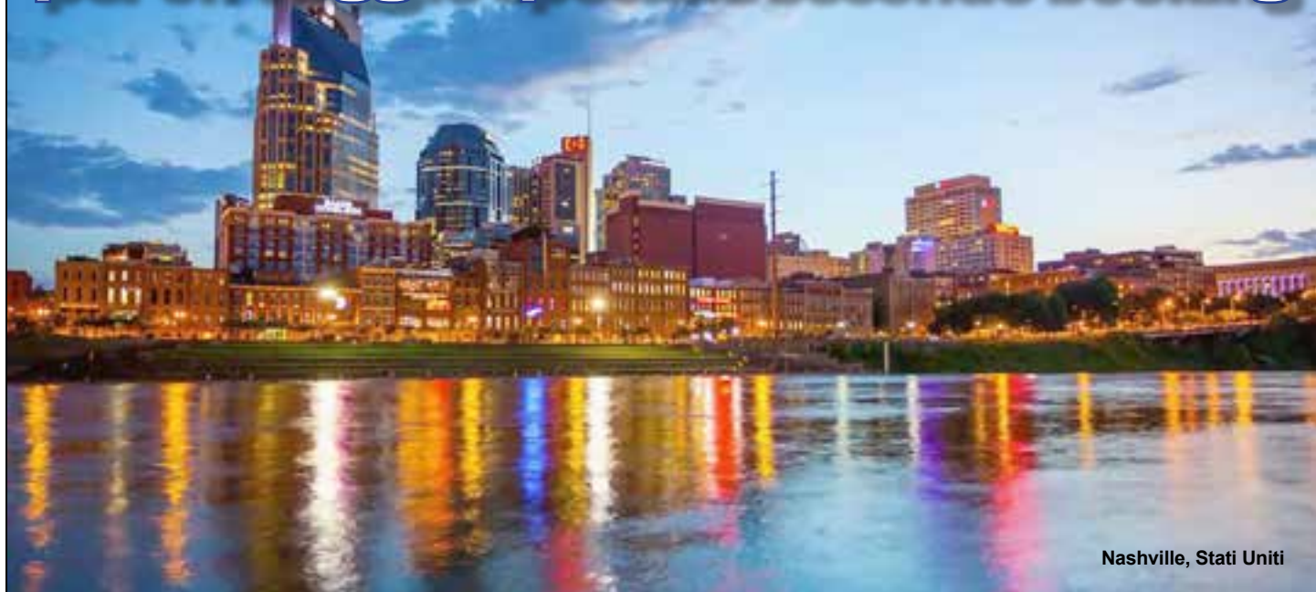
Nashville, Stati Uniti

Dimenticate New York, Tokyo, Londra e le Maldive. Se il prossimo anno volete visitare una meta emergente ed essere alla moda andate a Nashville, Bogotà o Lima. Ecco le 10 mete alternative preferite dagli italiani secondo il sito di prenotazioni online booking.com.