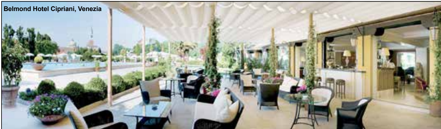
Belmond Hotel Cipriani, Venezia

Dal Mandarin Oriental di Milano al Timeo di Taormina, passando i saloni del Four Season di Firenze e nello SkyStar di Roma. Una selezione dei migliori luoghi del bere miscelato - con la ricetta di grandi drink -, in esclusiva per Sapori dalla neonata app BlueBlazer, la gratuita Guida ai migliori cocktail bar. L'elenco presta speciale attenzione all'ambiente, tra soffitti alti, banconi antichi e design ultra ricercato, dove top barman conquistano gli ospiti con fantasia spiccata e spirito d'accoglienza. Cornice di lusso e bellezza, nel cuore di grandi alberghi, e non per caso.