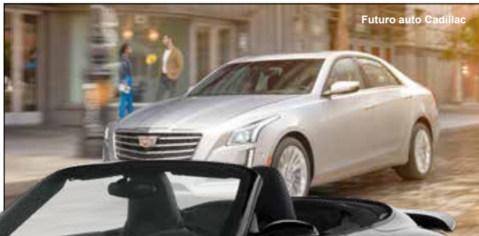
Futuro auto Cadillac

Come riportato dall'agenzia AGI, le case automobilistiche stanno sperimentando un meccanismo che consente agli automobilisti di guidare i propri veicoli per brevi periodi di tempo. Marchi come Porsche, Cadillac e Volvo hanno già dato il via al noleggio breve però per il momento il costo di questi abbonamenti è ancora decisamente elevato – partono da 600 dollari al mese - ma il tentativo è sperimentare nuovi modelli che servano a mettere un freno al crollo delle vendite.