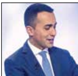
Luigi Di Maio