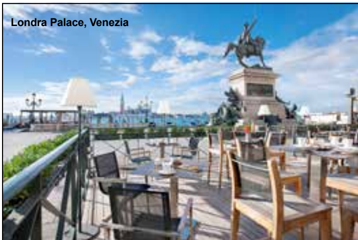
Londra Palace, Venezia

Sulla Riva degli Schiavoni vive adagiato il Londra Palace, un piccolo gioiello che sembra assorbire l'anima composta e regale della Serenissima. Lo stesso spirito anima anche il suo cocktail bar, tappa fissa per i visitatori che amano i grandi