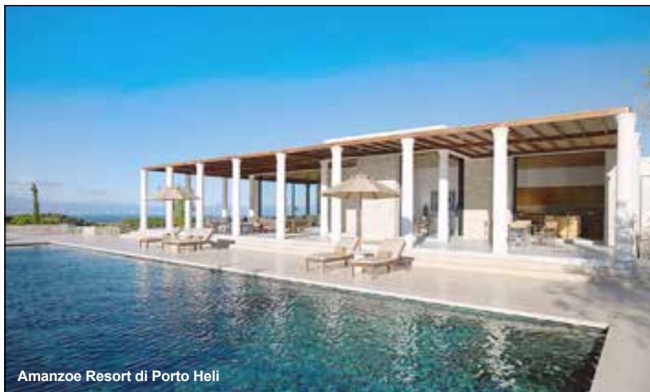
Amanzoe Resort di Porto Heli

Incastonato in uno sfondo azzurro di cielo e mare – le colonne della sua facciata sono inconfondibili. La facciata è arricchita da uliveti, lavanda selvatica e cipressi. Oltre al design, ha una posizione privilegiata sulla cima di una collina che affaccia sui monumenti storici, tra cui le cittadine di Atene e l'anfiteatro di Epidaurus, patrimonio mondiale dell'UNESCO. Ed Tuttle, l'architetto responsabile della progettazione di Amanzoe, è stato fortemente influenzato dall'architettura classica greca, contaminandola con un'attitudine contemporanea. Nel 2016, Amanzoe Resort è stato nominato l'hotel più caro d'Europa da Luxury-Hotels.com. Il prezzo più conveniente per una camera doppia nel periodo compreso tra il 1° luglio e il 31 agosto è stato di 1.779 euro e la