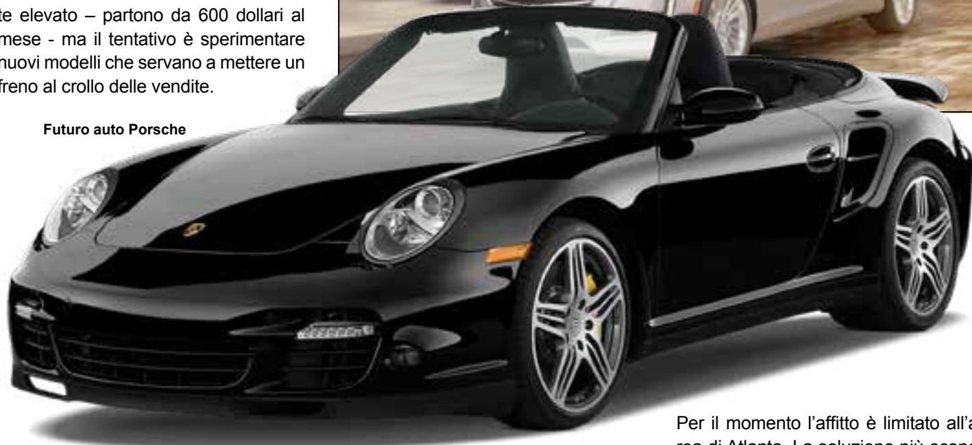
Futuro auto Porsche

Nel 2017, per la prima volta in otto anni, negli Stati Uniti il numero di veicoli nuovi venduti è diminuito. Alcune case automobilistiche si sono quindi mosse nella direzione di offrire al cliente soluzioni di leasing a breve termine. Cadillac, per esempio, ha avviato il progetto Book. Per 1.800 dollari al mese si possono cambiare diciotto auto nel corso di un anno, a scelta tra cinque diversi modelli – dalle più sportive al SUV Escalade, con un prezzo di mercato superiore a centomila euro.